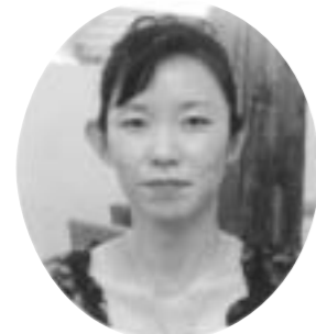
スピリチュアル・カウンセラー Abundance 慶

例えば、水は「H 2 O」。H：水素原子2個と、O：酸素原子が1個が引っ付いて水ができているという話でしたよね。